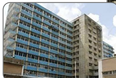
Hospital Dr. Miguel Pérez Carreño