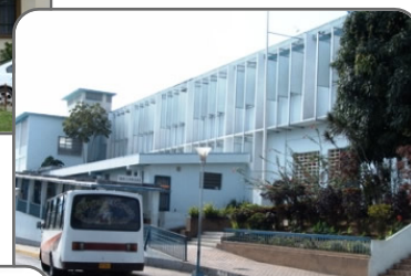
Hospital Dr. Jesus Yerena (Lídice)