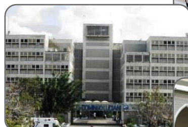
Hospital Dr. Domingo Luciani