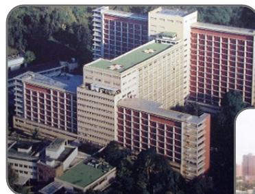
Hospital Militar Dr. Carlos Arvelo