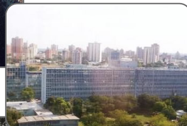
Hospital Universitario de Maracaibo