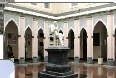
Hospital Vargas de Caracas