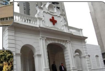
Hospital de la Cruz roja Venezolana